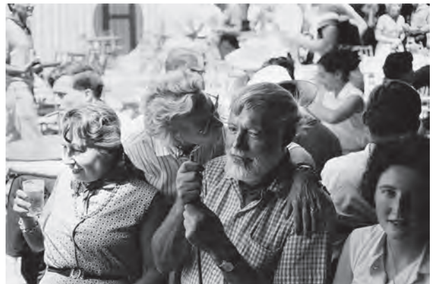
Las fotografías pertenecen a la Exposición "Sanfermines 1959: Ernest Hemingway en el objetivo de Julio Ubiña"